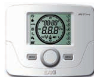
Termostato modulante programable

También existe la posibilidad de crear un pack de alta eficiencia energética, combinando la caldera con la energía solar térmica, consiguiendo así un ahorro superior en la factura energética.