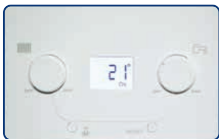
Cuadro de control

Además, la pantalla retroiluminada que integra permite ver el estado de la caldera y los principales datos de funcionamiento como temperaturas o posibles códigos de anomalía.