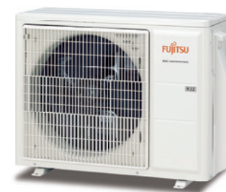
ASY 25 -35 UI-KP