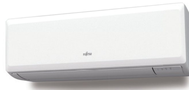
ASY 25 -35 UI-KP